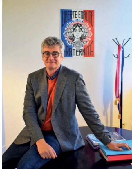
Jean Christophe CARRÉ, Maire de Maussane-les-Alpilles

Avec une vaccination record de plus de 60% de la population adulte, Maussane-les-Alpilles fait figure de bon élève. C'est un succès collectif et, une nouvelle fois, je remercie tous ceux et celles, médecins, infirmières, pompiers, personnels de la commune et celui du Bus départemental de la vaccination ainsi que les élu.e.s de Maussane-les-Alpilles qui se sont mobilisés de façon exemplaire.