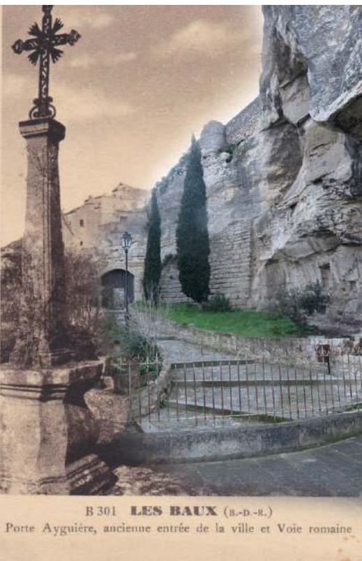
B 301 LES BAUX (B.-D.-R.)

Contact : terresdesbaux@laposte.net 7, route des Tours de Castillon 13520 Le Paradou