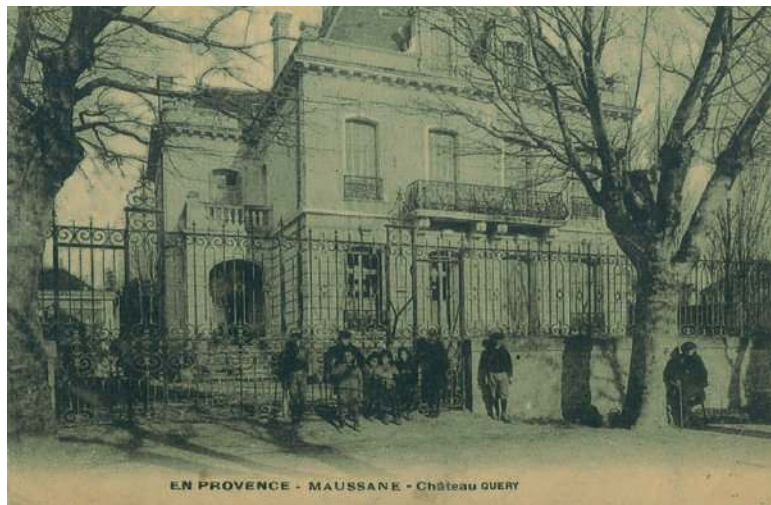
EN PROVENCE - MAUSSANE - Château QUERY